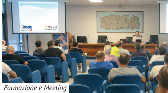
Formazione e Meeting

Diventa partner della nostra grande realtà, per costruire insieme il team vincente.